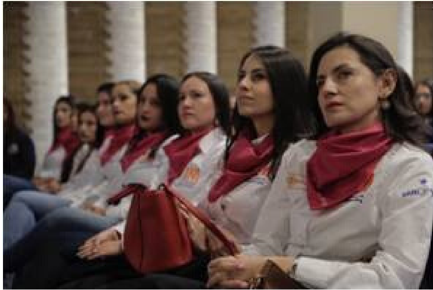
Table-ronde à Bogota Colombie