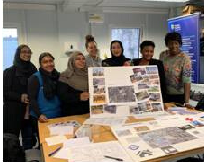
Atelier de découverte à Londres Royaume-Uni