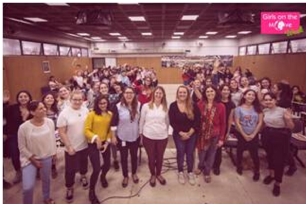
Conférence à Buenos Aires Argentine