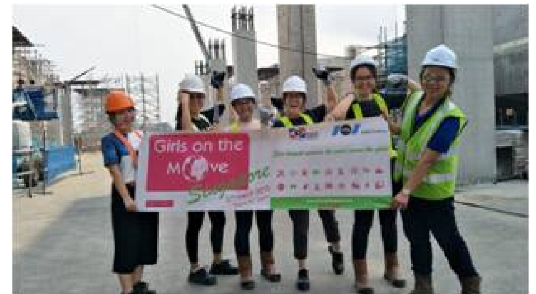
Visite de sites à Singapour