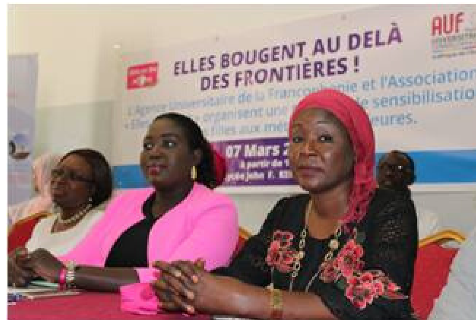
Table-ronde à Dakar Sénégal