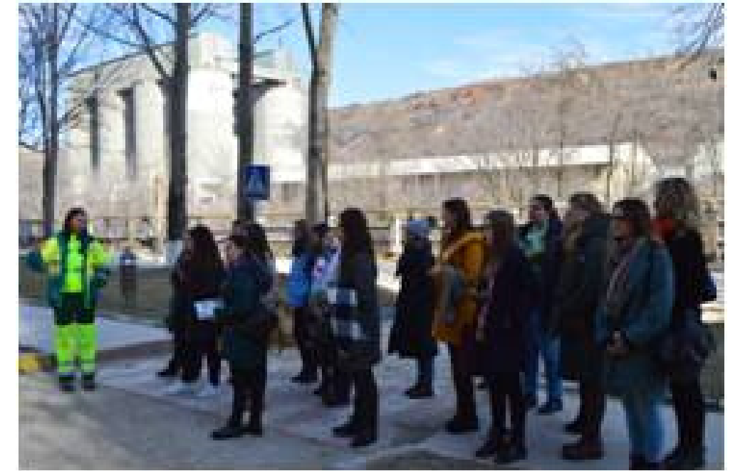
Visite de sites à Rezina Moldavie