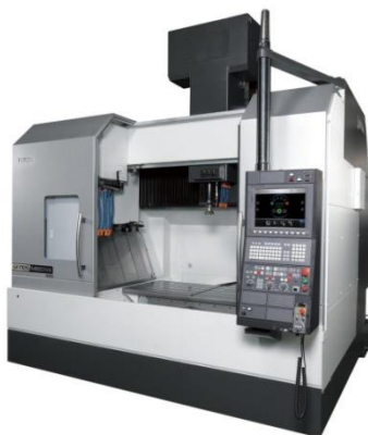
Fig. 1.1. Centru de prelucrare CNC

Sursă: https://greenbau.ro/centru-de-prelucrare-cnc-si-caracteristici/